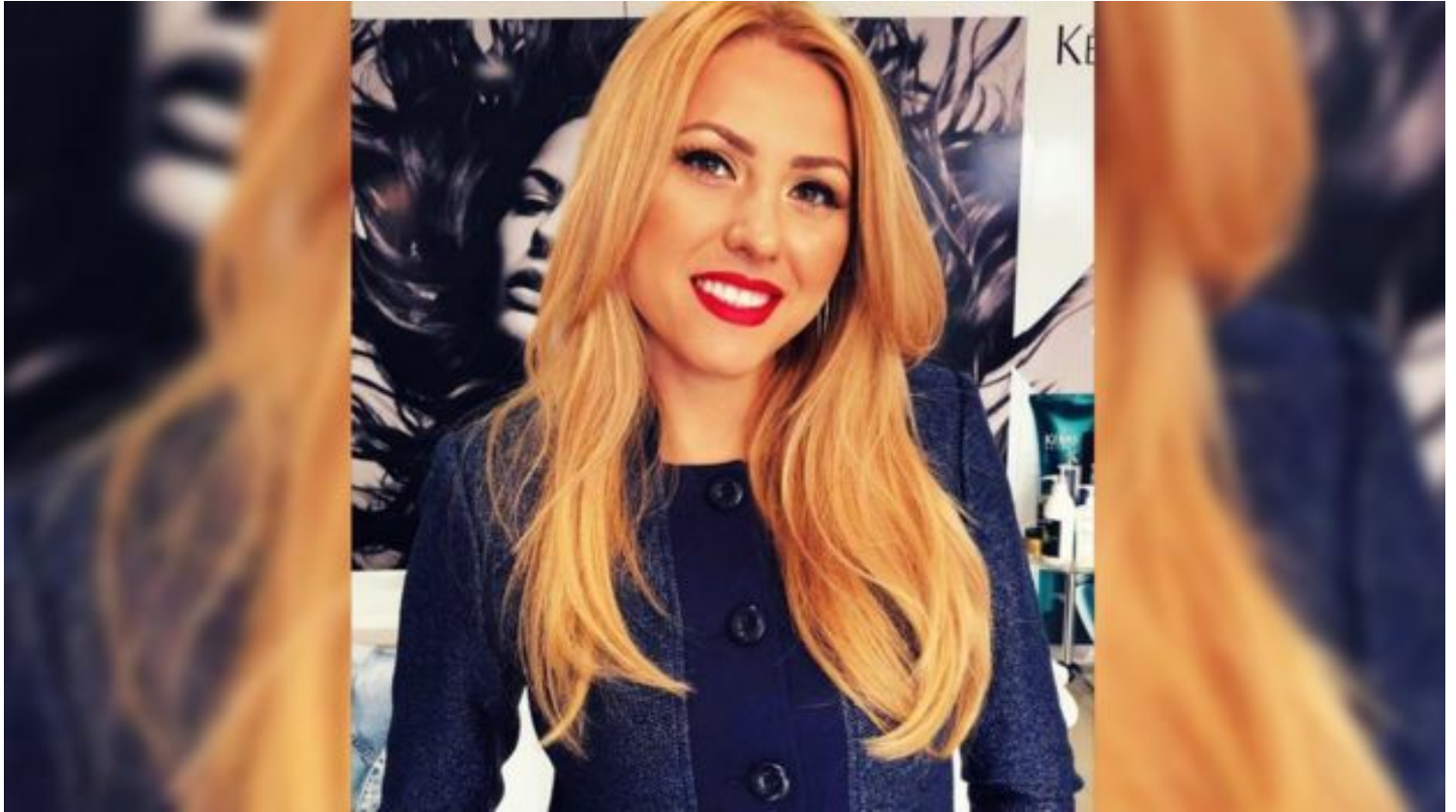
Image captionViktoria Marinova era presentadora y directora administrativa del canal local privado búlgaro TVN. Presentaba su propio programa, "Detector", en el pequeño canal privado local de televisión TVN.

El 30 de septiembre emitió una entrevista con dos periodistas que estaban investigando a políticos y empresarios por un posible caso de corrupción con fondos de la Unión Europea en la construcción de infraestructuras.