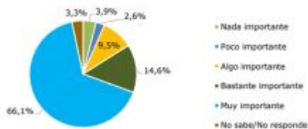
Figura 20. ¿Cuán importante considera usted que es para el país que se cambie la actual Constitución?

Fuente: Encuesta Termómetro Social, octubre 2019. Estimaciones propias.