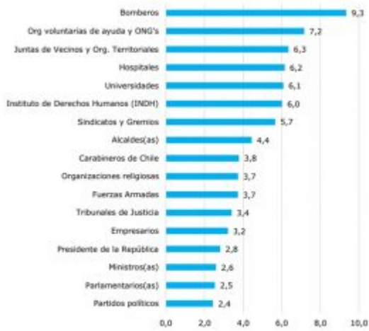
Figura 9. Evaluación de confianza en instituciones escala de 1 a 10