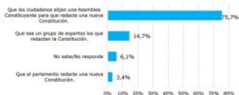
Figura 22. En Chile hay distintas opiniones sobre cómo cambiar la Constitución. Si se cambiara la Constitución, ¿cuál de las siguientes opciones representa mejor su opinión?